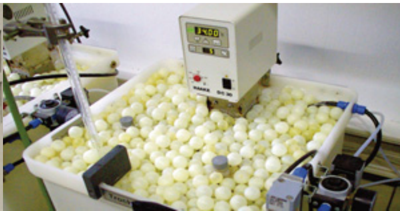
Prüfung am Wasserbad

Die Temperatur, die die Ethanol-Wasser-Lösung im Alcolcal besitzt, wird über eine am Prüfgasgenerator vorhandene Messstelle für ein externes, kalibriertes Thermometer gemessen. Bei einer automatisierten Durchführung der Prüfungen am Gebrauchsnormal werden die am Prüfling angezeigten Einzelergebnisse für Konzentration und Temperatur durch die Software automatisch auf Einhaltung der vorgegebenen Fehlergrenzen überprüft und bewertet. Diese von der Software vorgeschlagene Bewertung ersetzt jedoch nicht die abschließende Bewertung der Messergebnisse durch den Eichbeamten. Die Messprotokolle werden auf die korrekte Eingabe der von Hand eingegebenen Daten (Konzentration der Ethanol-Wasser Lösung, Eichgültigkeit) vom Eichbeamten kontrolliert.