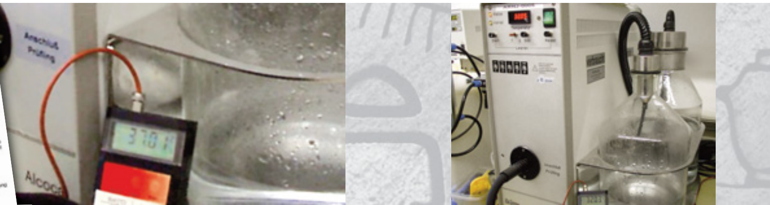
Prüfgasgenerator mit einer Referenzlösung

Probenabgabe) verursacht werden. Um also eine Gleichbehandlung aller Probanden zu gewährleisten wird die tatsächlich gemessene Alkoholkonzentration bei einer bestimmten Atemtemperatur auf die Bezugstemperatur von 34°C umgerechnet.