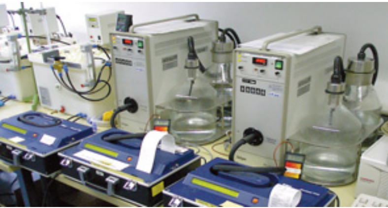
Prüfung mit Prüfgasgenerator